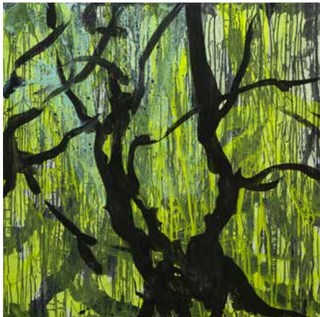
Helga Maria Nieder: BREZMEJNA akril na platnu