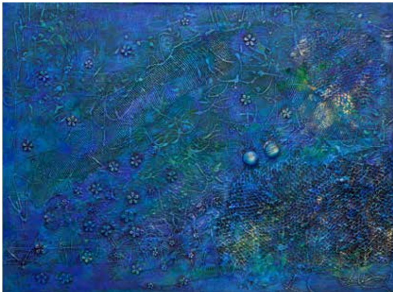
Erna Ferjanič: MURA - kombinirana tehnika