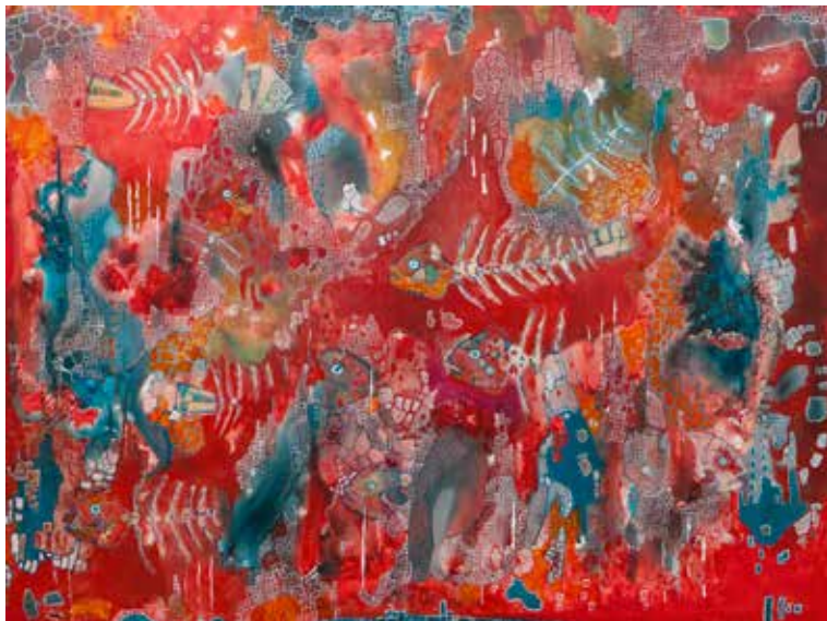
Tatjana Mijatović: KRVAVA REKA - akril na platnu