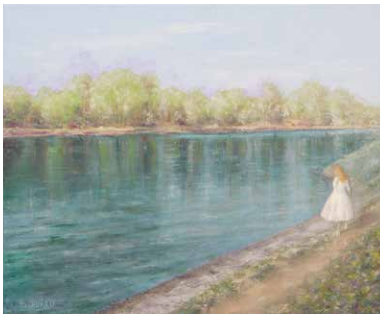
Brane Murko: DOL OB REKI - olje na platnu