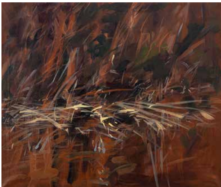
Rado Jerič: MURA - akril na platnu