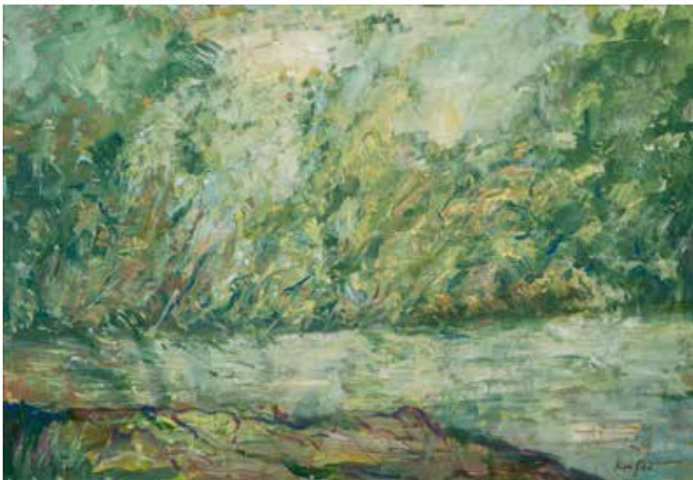
Zlatko Krajič: TAM PRI MURI - akril na platnu