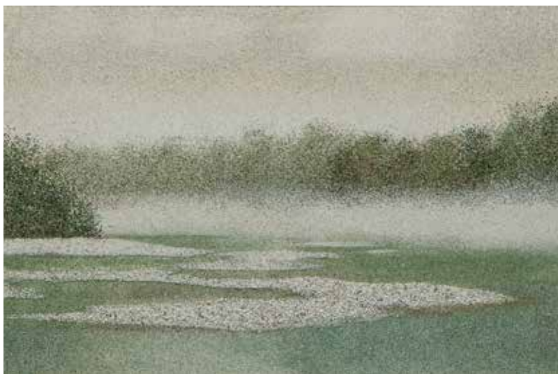
Stanka Golob: SUŠNO POLETJE - slovenski peski