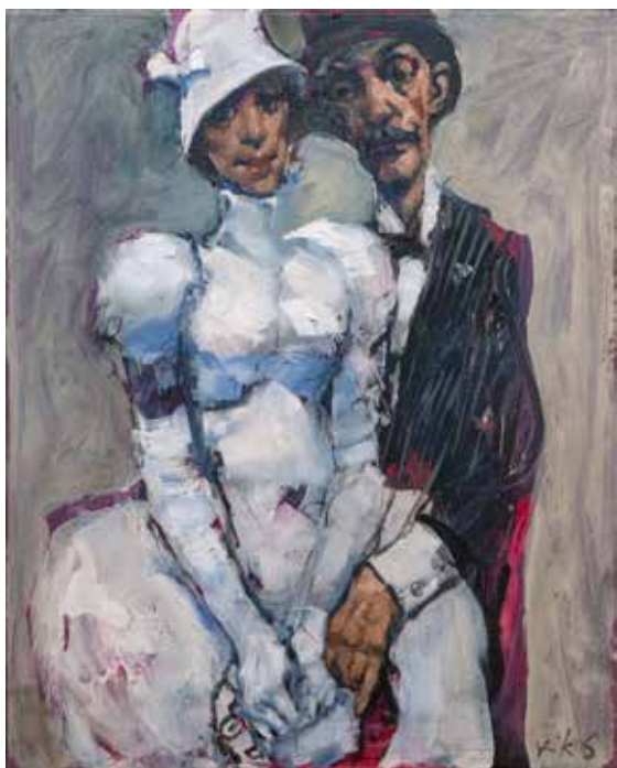
Viktor Šest: SVATBA olje na platnu