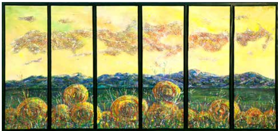
Matjaž Duh: ZAVESTNE OVIRE NAJKLJUČNEGA - mešana tehnika