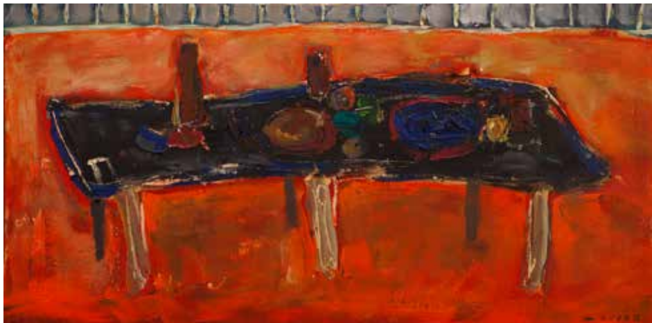
Jože Denko: MIZA - akril na platnu