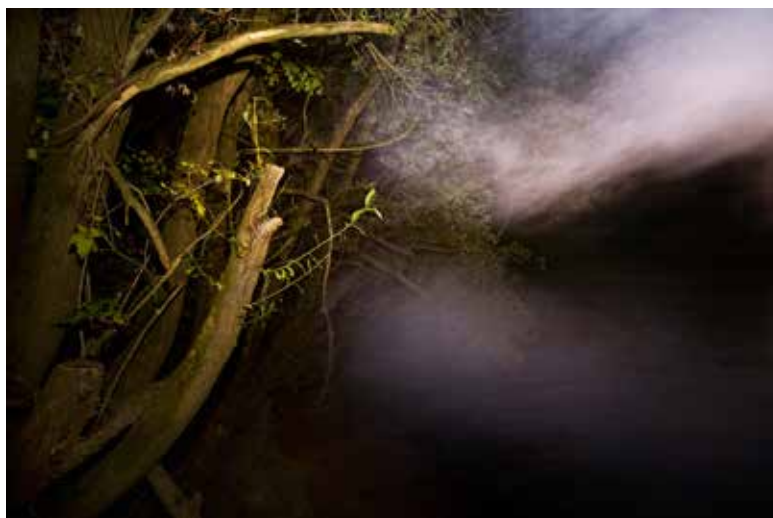
Ivo Borko: UPANJE fotografija