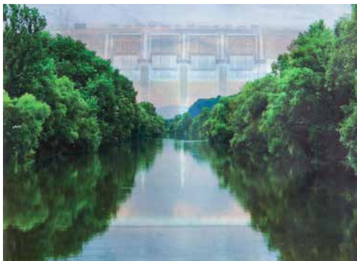
Eva Žula: KO PRESTOPIŠ MEJO - knjiga umetnika