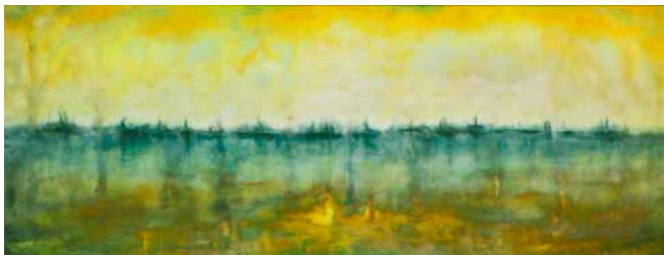
Vinko Prislan: MURA - olja na platnu