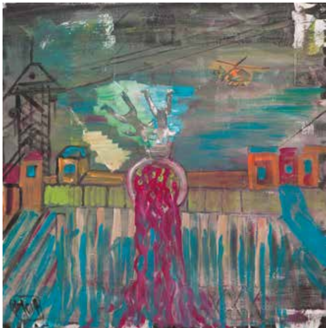
Ely Magos: JEZ akril na platnu