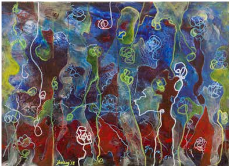
Jerneja Hercog: MURSKI DEMONI - akril na platnu