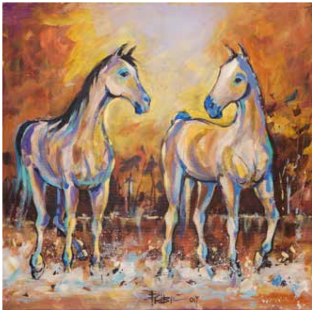
Niko Ribič: ONA IN ON OB MURI akril na platnu