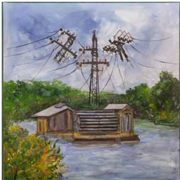
Bogdan Čobal: OGROŽENA IDILA akril na platnu