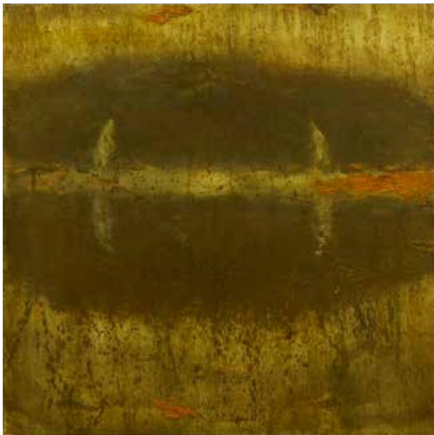
Igor Banfi: NA OBALI olje na platnu