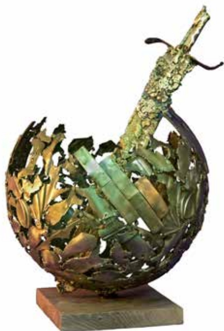
Leopold Methans: DAMOKLJEJEV MEČ NAD REKO kij