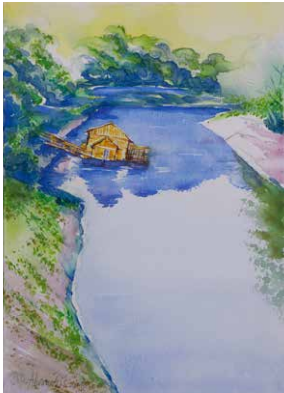
Duško Abramušić: OGROŽENA DEDIŠČINA akril na platnu