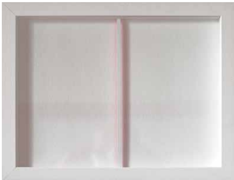
Ignac Meden: 3a - 1 - akril, les